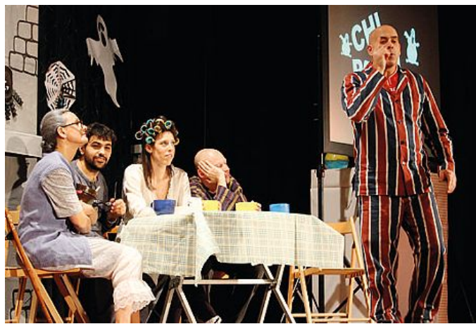
I genitori e attori sul palco di Lavis