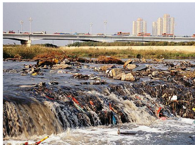
Nel 2025 un terzo della popolazione mondiale non avrà acqua potabile

Associazioni e Comune propongono laboratori e una serata sull'emergenza idrica mondiale