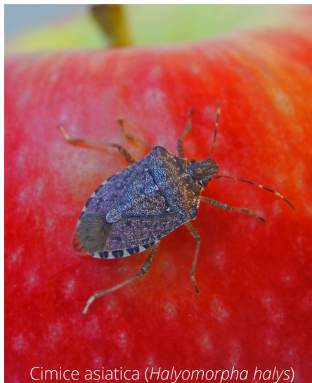
Cimice asiatica ( Halyomorpha halys )

CONTRIBUISCI ALLA PRODUZIONE DEGLI INSETTI ANTAGONISTI CHE POTRANNO COMBATTERE LA CIMICE ASIATICA